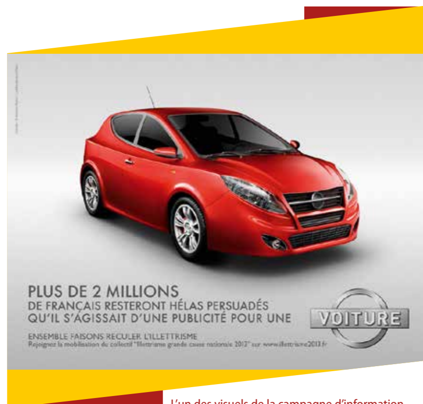
L'un des visuels de la campagne d'information Grande cause nationale 2013

Ces personnes ont en commun de cacher leurs difficultés, de ne pas oser dire qu'elles ne savent pas lire ou écrire alors qu'elles ont été scolarisées. Et pourtant, il est possible de réapprendre quel que soit son âge ou de consolider des acquis, même s'ils sont faibles, que l'on soit dans l'emploi ou à la recherche d'un emploi. Il est aussi possible de prévenir l'illettrisme, d'agir en amont pour qu'il ne s'installe pas en familiarisant les tout-petits avec les mots, avec les livres, en accompagnant les parents pour suivre la scolarité de leurs enfants et en les soutenant dès les premières difficultés, en créant des conditions favorables à la réussite des premiers apprentissages, en évitant que les jeunes décrocheurs ne tombent dans l'illettrisme.